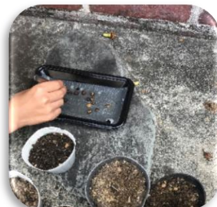
ピンセットで種を穴に入れていきます