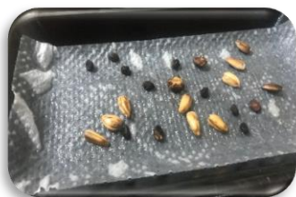
1日目：種を準備しました