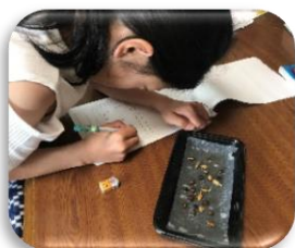
子供が自分なりに記録を取ります