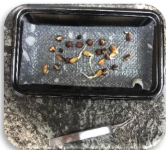
4日目：種を植えます