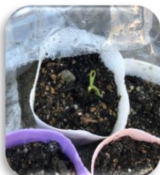
5日目：ひまわりの芽がでました。