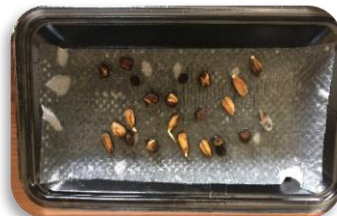
3日目：ひまわりの芽がでました