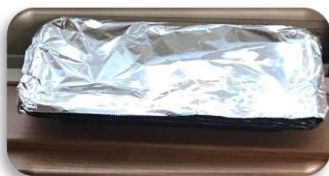
アルミホイルを掛けて窓際に