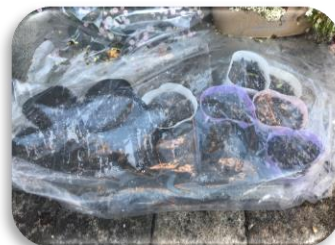
ビニールを掛けました