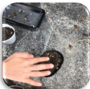
ポットに指で穴をあけます