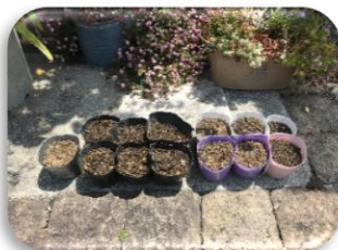
左の黒いポットがアサガオ、色付きのポットがひまわりです